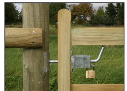
Låsbult för trägrindar: Säkerhetslåsanordning som monteras inuti grindramen. Kan låsas med hänglås.