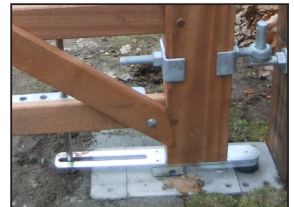
Perfakta för portautomatik. Här visade med nedgjutningsmotor.

Country House levereras även i tryckimpregnerat utförande.