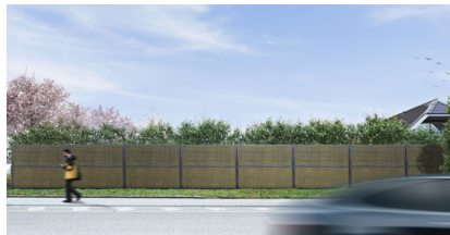
Antracit RAL 7016