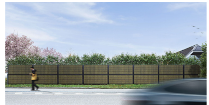
Svart RAL 9005