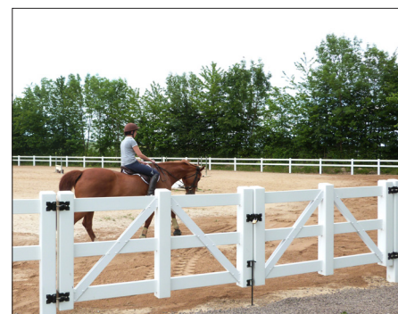
Dallas-ridbana med staket med 2 slanor och matchande dubbelgrind

Kontakta ditt närmaste Poda-center om möjligheterna.