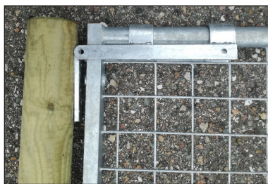
Fallregel med beslag för montering på stolpe. För stålgrindar och låga lättviktsgrindar (t.o.m. 130 cm)