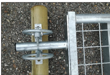
Anslagsregel för lättviktsgrindar, för säkerhetsfallregel (medföljer inte)