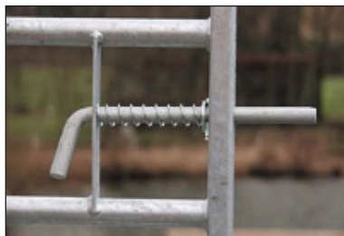
Låsbult med fjäder, för stålgrindar