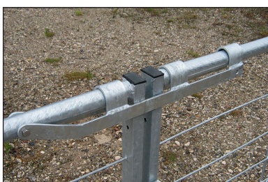
Fallregel för stålgrindar och låga lättviktsgrindar (t.o.m. 130 cm)