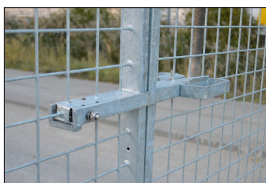
Fallregel för höga lättviktsgrindar (fr.o.m. 145 cm)