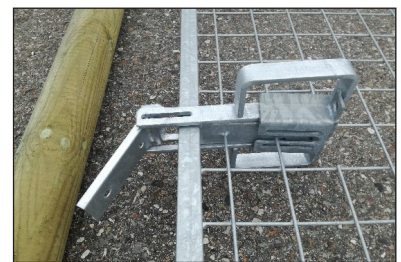
Fallregel med beslag för montering på stolpe. För höga lättviktsgrindar (fr.o.m. 145 cm)