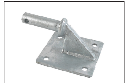
Tapp med monteringsplatta